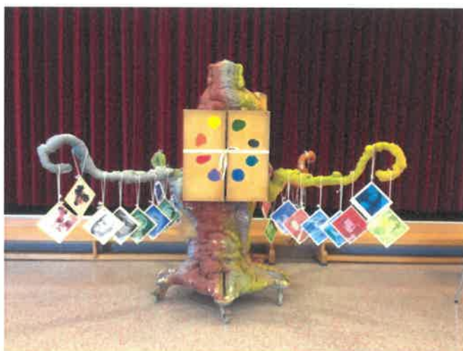
Hyllen er laget av Frode Holgersen ved Kilden Teater- og Konserthus